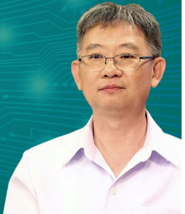
นายแพทย์โอกาส การย์กวิณพงศ์ ปลัดกระทรวงสาธารณสุข